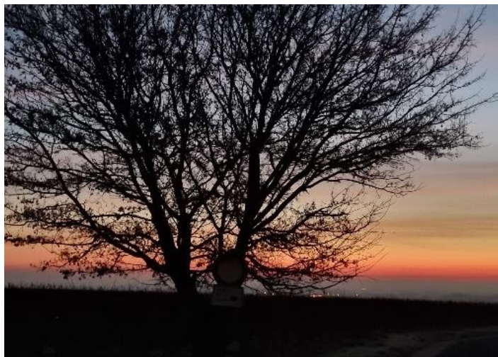
Sonnenaufgang über Edesheim

Burrweiler, Edenkoben, Edesheim, Flemlingen mit Böchingen, Gleisweiler mit Frankweiler, Hainfeld mit Rhodt, Roschbach mit Walsheim, Sankt Martin und Weyher